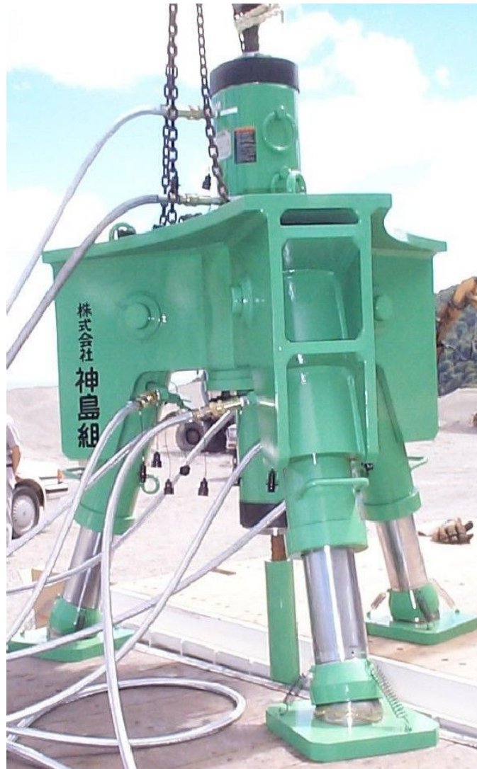
芯割りジュニア用三脚架台