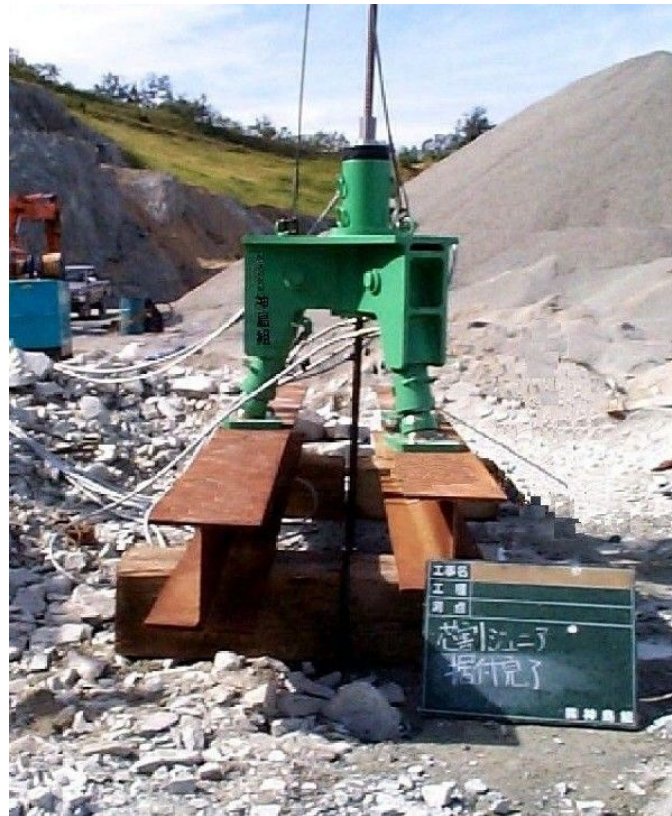
芯割リジュニア据付完了