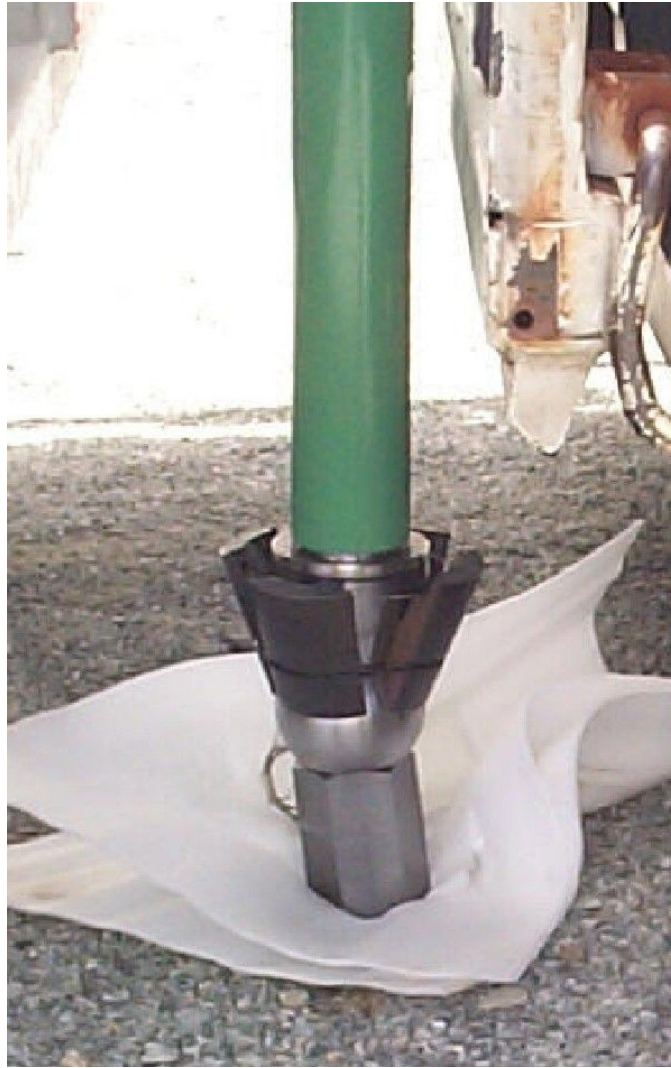
芯割りジュニア本体