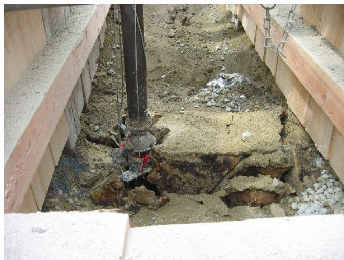
芯割リジュニア破碎完了