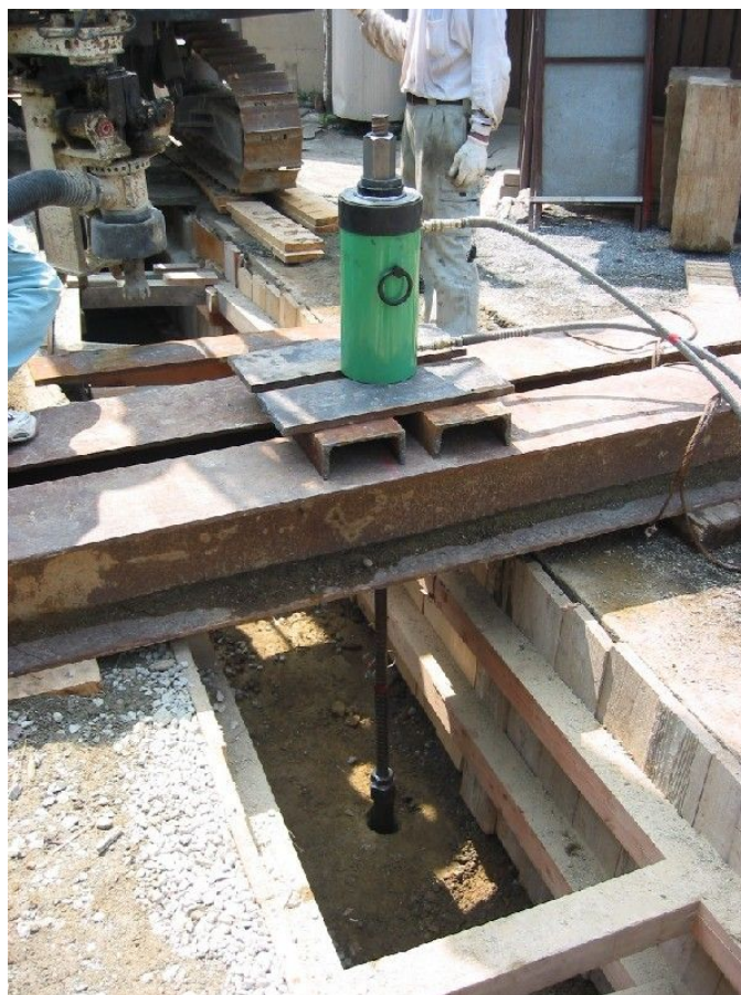
H型鋼架台(立坑内・土留矢板内・台船での施工に適用