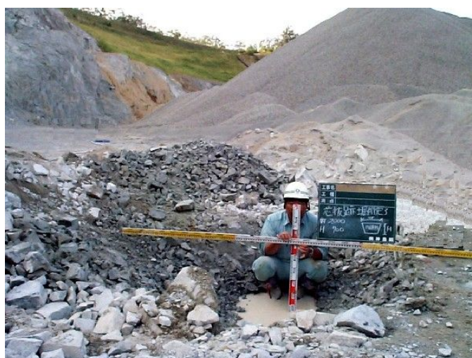
芯割リジュニア破碎確認状況