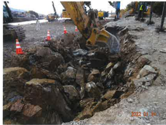
「スーパーくさび君」工法 破碎・リップバ引起し状況

同時に騒音振動を測定し結果は10mで騒音83dB,振動55dB。20mで騒音76dB,振動54dB を記録し特定建設作業の規格値内で作業可能であることを確認。