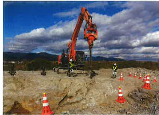
「特殊くさび式割岩装置（Wボルト仕様）」パイプロ引抜状況