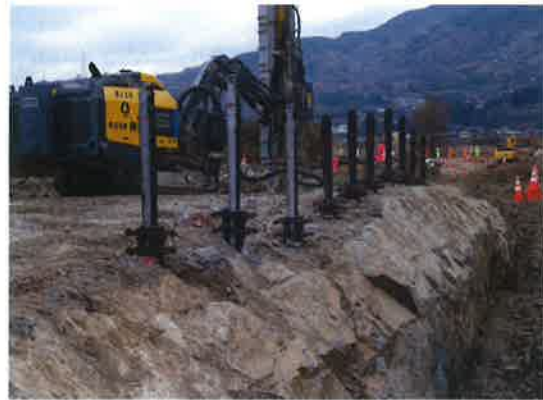
「スーパーくさび君」特殊くさび式割岩装置 (Wボルト仕様) 建込完了

道路新設・道路改良工事・河川・河床掘削工事・造成工事等の大規模なオープン掘削工事。