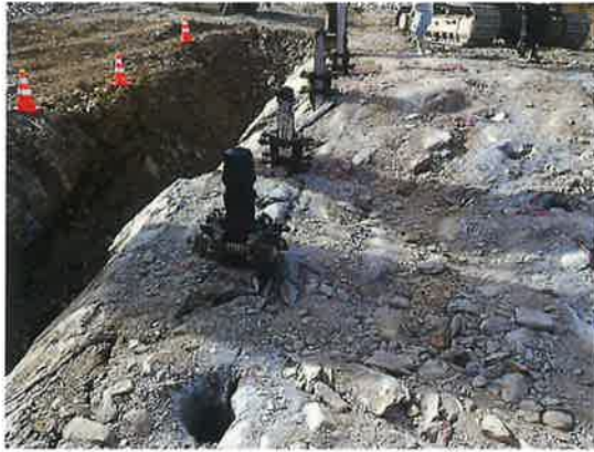
「スーパーくさび君」工法 破碎完了（特殊くさび式割岩装置（Wボルト仕様）打込完了）