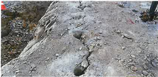
「特殊くさび式割岩装置（Wボルト仕様）」引抜後亀裂状況