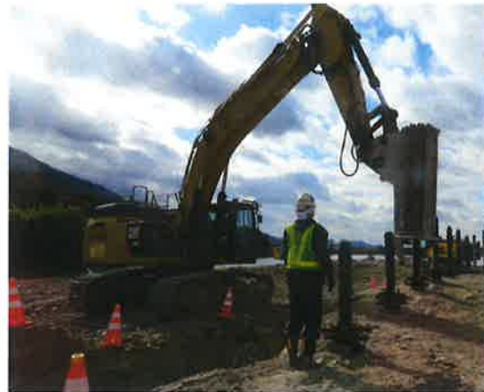
「スーパーくさび君」工法 破碎状況