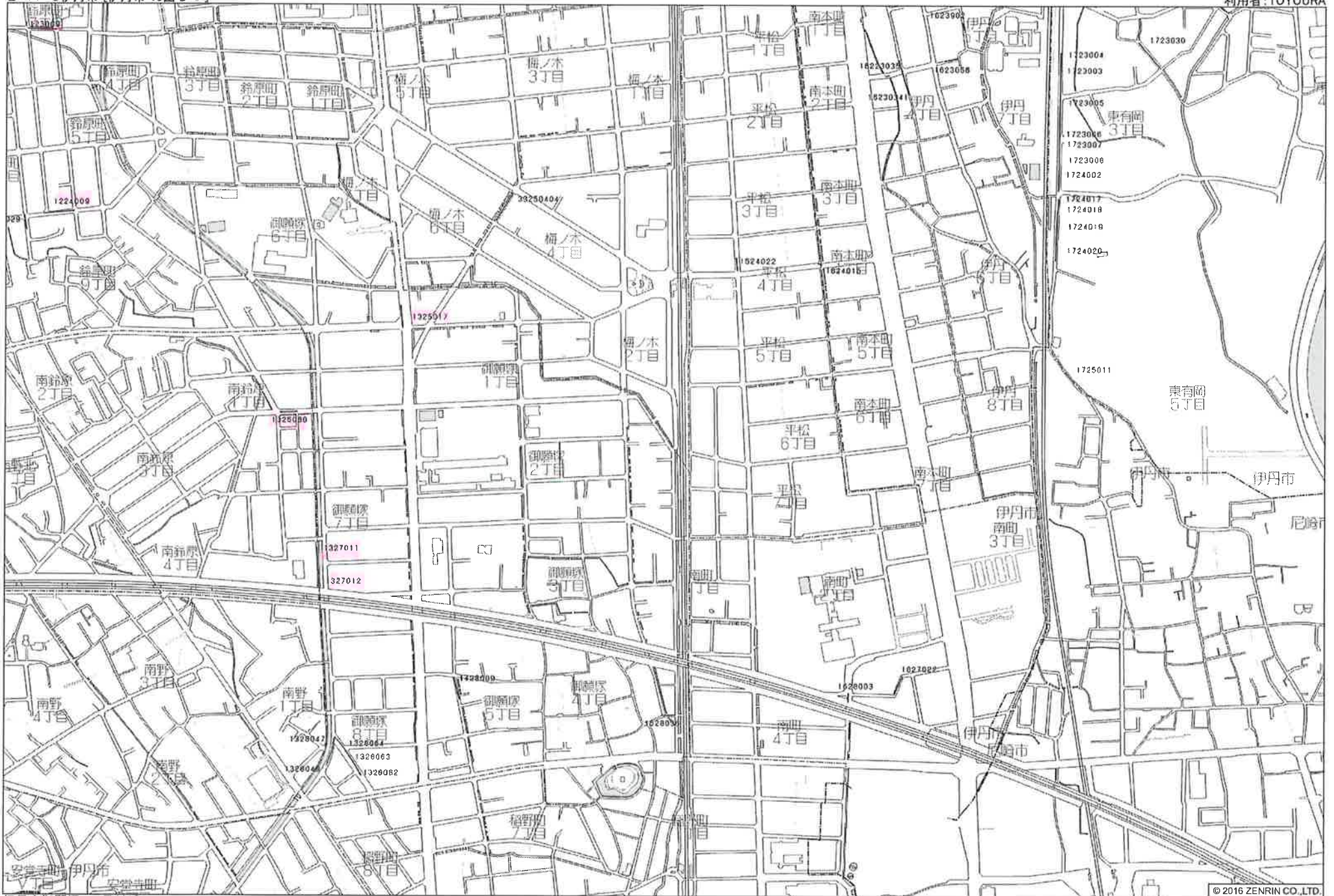
伊丹市御願塚2丁目付近