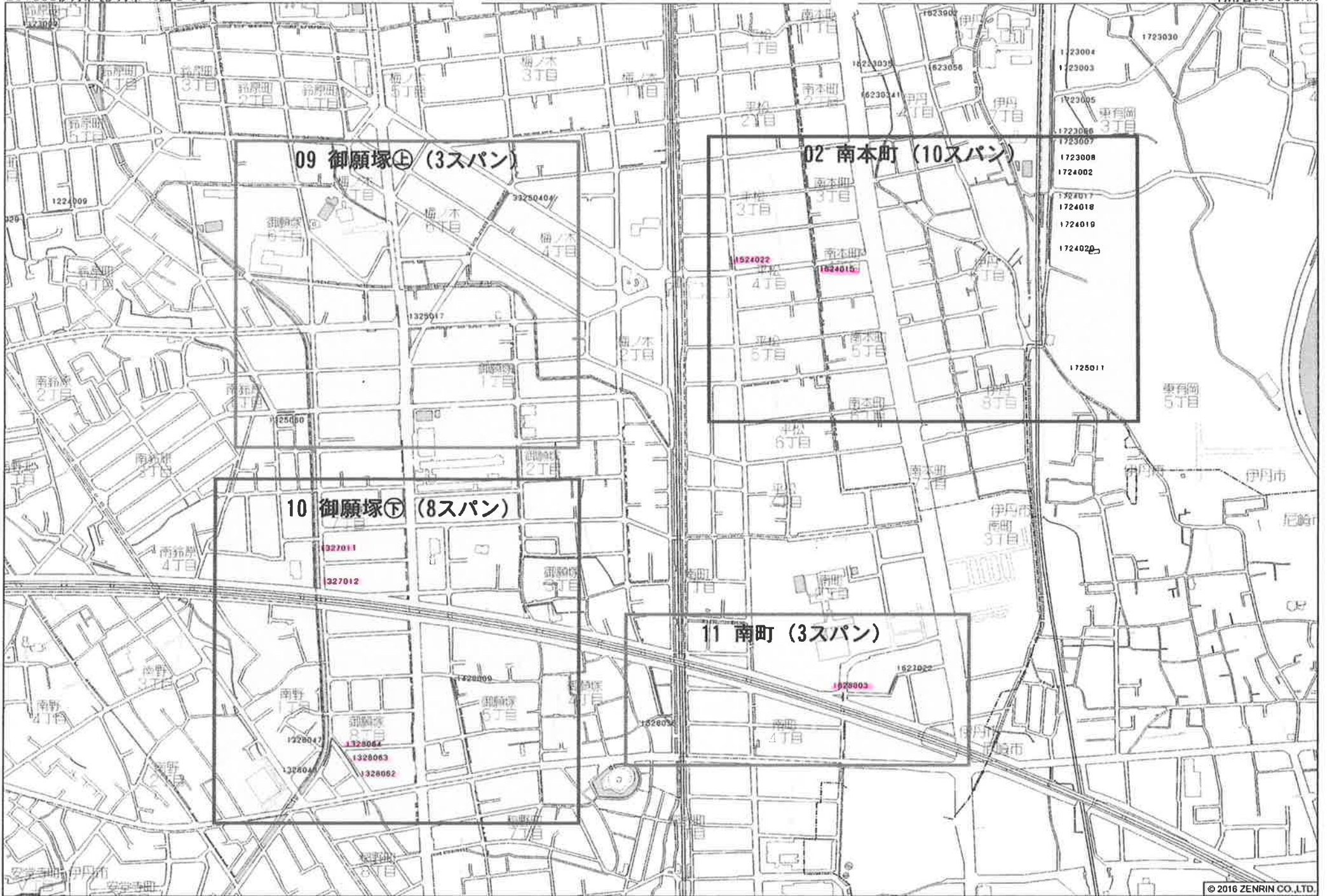
伊丹市御願塚2丁目付近