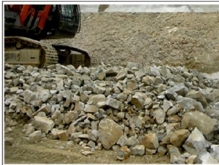
かち割る君工法 実証実験状況