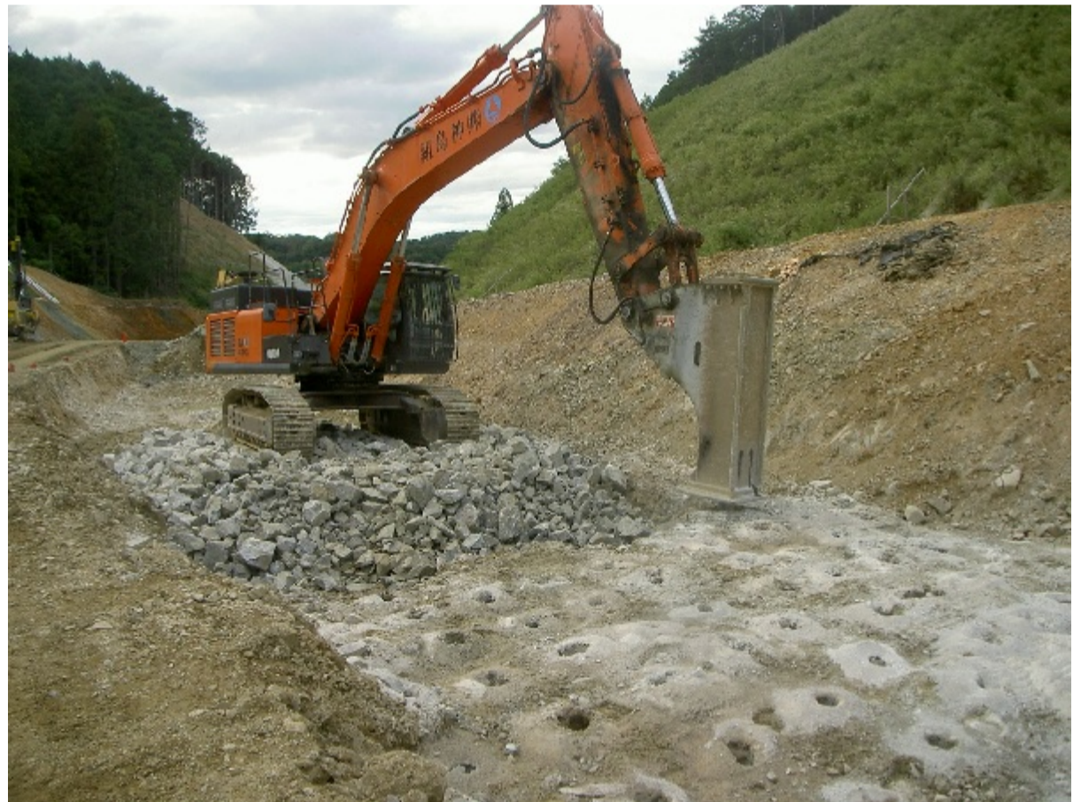
かち割る君工法 中硬岩破碎