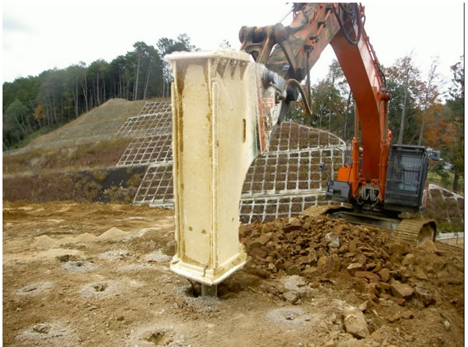
「かち割る君工法」岩盤破碎状況