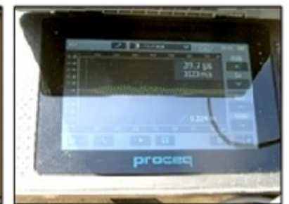
弾性波速度の測定