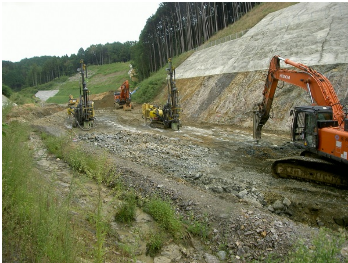
かち割る君工法 施工箇所例