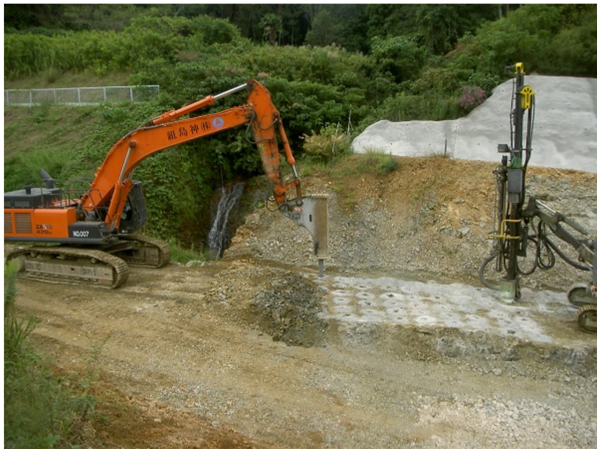
かち割る君工法 作業状況