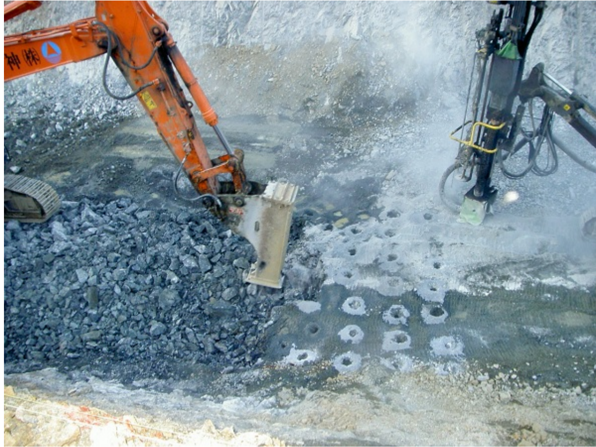
かち割る君工法 小割状況