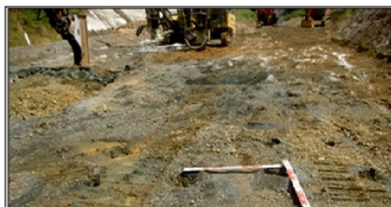
ピッチ換尺 削孔 φ102mm