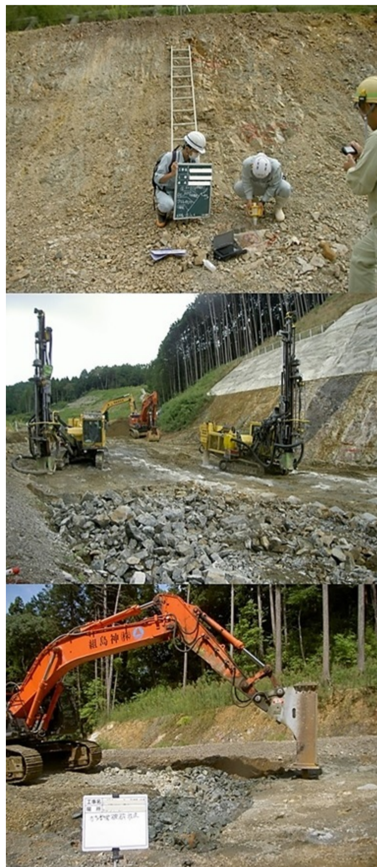
かち割る君工法作業状況(岩判定～削孔～破碎)