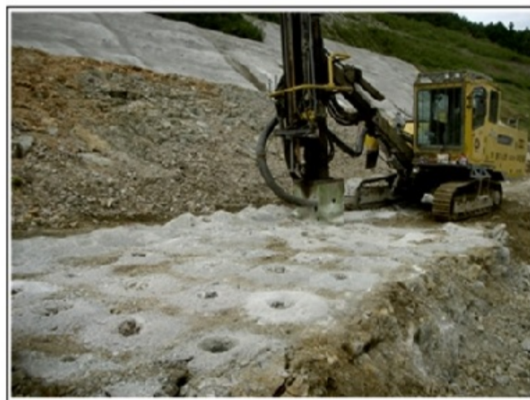
削孔状況 低騒音型クローラドリル エピロック T45