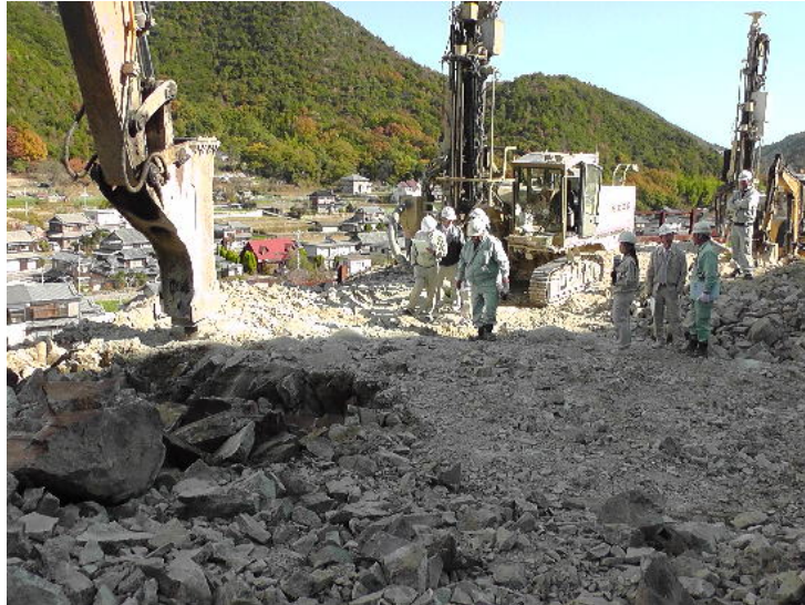
「かち割り君」岩盤破碎

実験結果1～3で中硬岩。実験結果4で硬岩Ⅰが簡単に破碎できること、騒音振動が特定建設作業の規定値内で作業できることが確認できた。