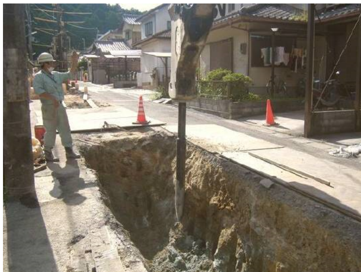
「かち割り君」溝堀(別途見積)