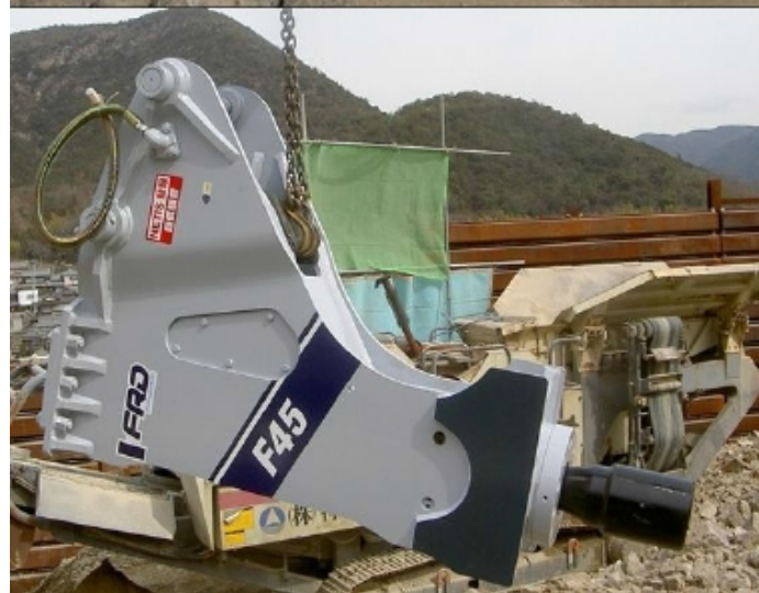
超低騒音ブレーカ