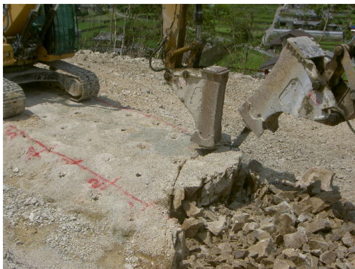
クサビ型チゼルを取り付けた「かち割り君」による破碎

・岩盤掘削工法:クォーターセリ矢(KK-040044-A)・岩盤法面整形工法スリット君(KK-100015-A)など使用