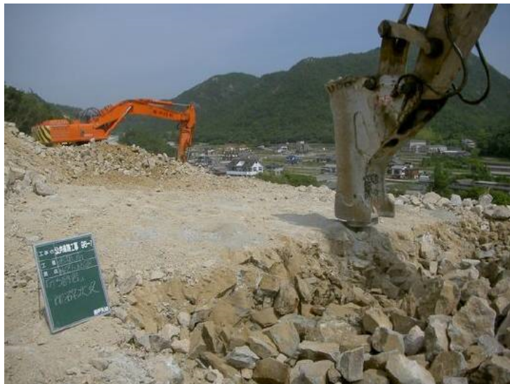
「かち割り君」作業中

3.「静マル君」・超低騒音型大型ブレーカを使用することにより、周辺環境や作業環境へ配慮した低公害工法を構築した。また、従来の大型ブレーカの打撃による破壊は連続した金属音が長時間響いていたが、孔毎にチゼルを挿入し割裂するため連続音にはならず粉塵も低減できる。